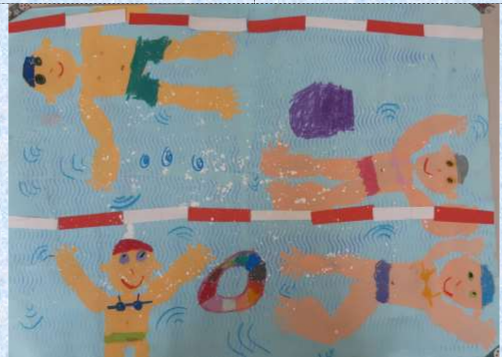
二年孝班 陳柔伊 美展佳作