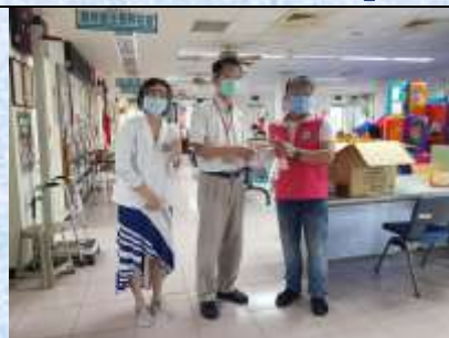
捐贈淡水區衛生所