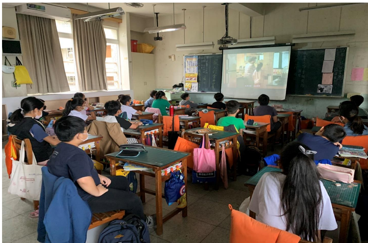
家庭教育-小朋友專心看影片-坐飛機的刺瓜仔湯